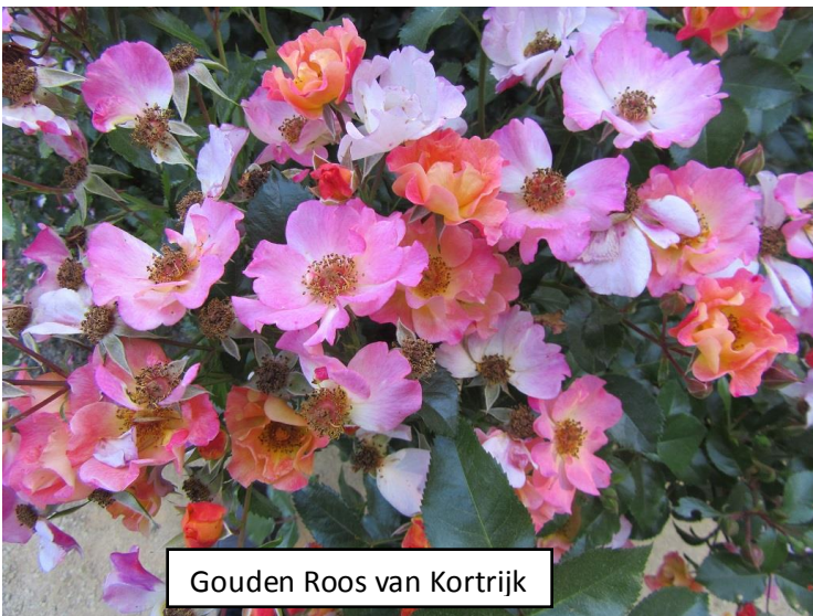
Gouden Roos van Kortrijk

De laatste jaren zien we wijzigingen en de renovatieplannen zijn reeds gedeeltelijk aangepast. Storende gebouwen zijn ondertussen afgebroken en het historisch kasteelgebouw staat in de steigers. De